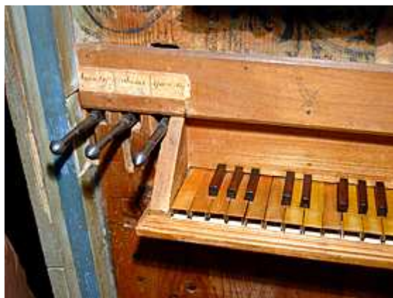
L'orgue résonne depuis plus de 550 ans.

L'orgue de Valère est considéré comme «le plus ancien au monde qui fonctionne encore». Construit aux environs de 1430, cet instrument unique est au cœur d'un festival d'orgue gothique, qui a lieu depuis quarante ans à Sion, capitale du Valais.