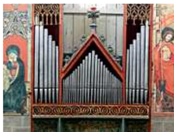
L'orgue de Valère