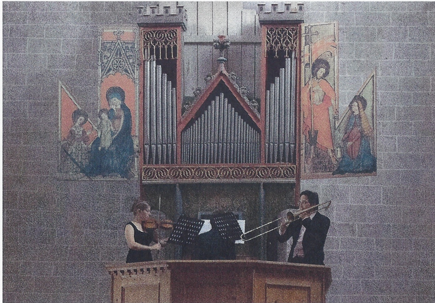
► L'orgue de Valère