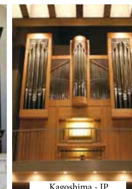
Kagoshima - JP