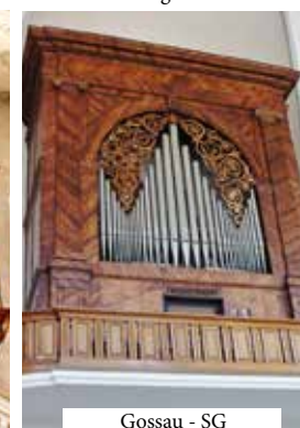
Gossau - SG