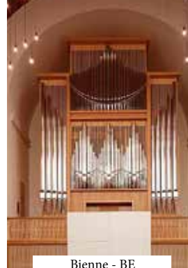
Bienne - BE

Tous nos concerts sont soumis aux règles en vigueur émises par l'OFSP et par le canton du Valais.