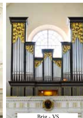
Brig - VS