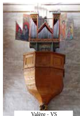
Valère - VS