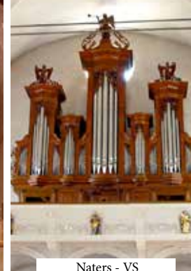
Naters - VS