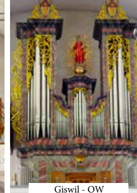
Giswil - OW