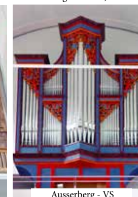
Ausserberg - VS