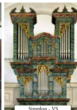
Simplon - VS