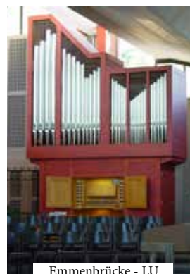
Emmenbrücke - LU