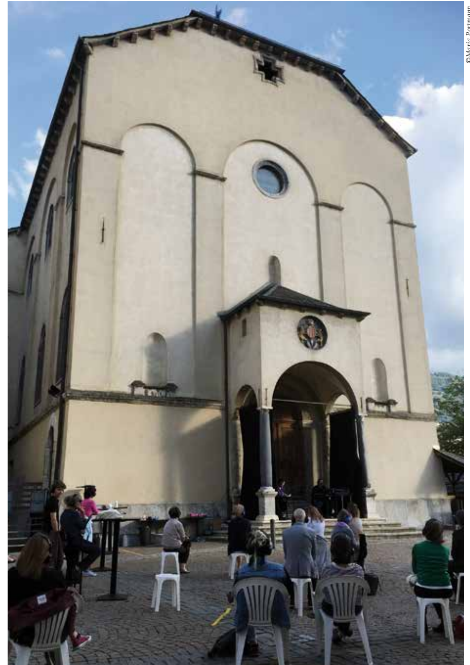
la cathédrale de Sion