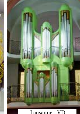
Lausanne - VD